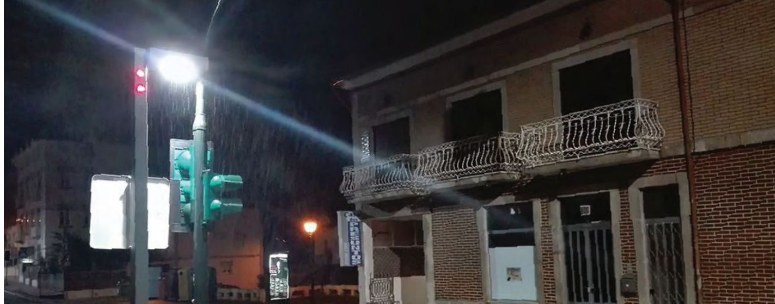
Termas S. Vicente, Penafiel, Portugal Termas S. Vicente, Penafiel, Portugal