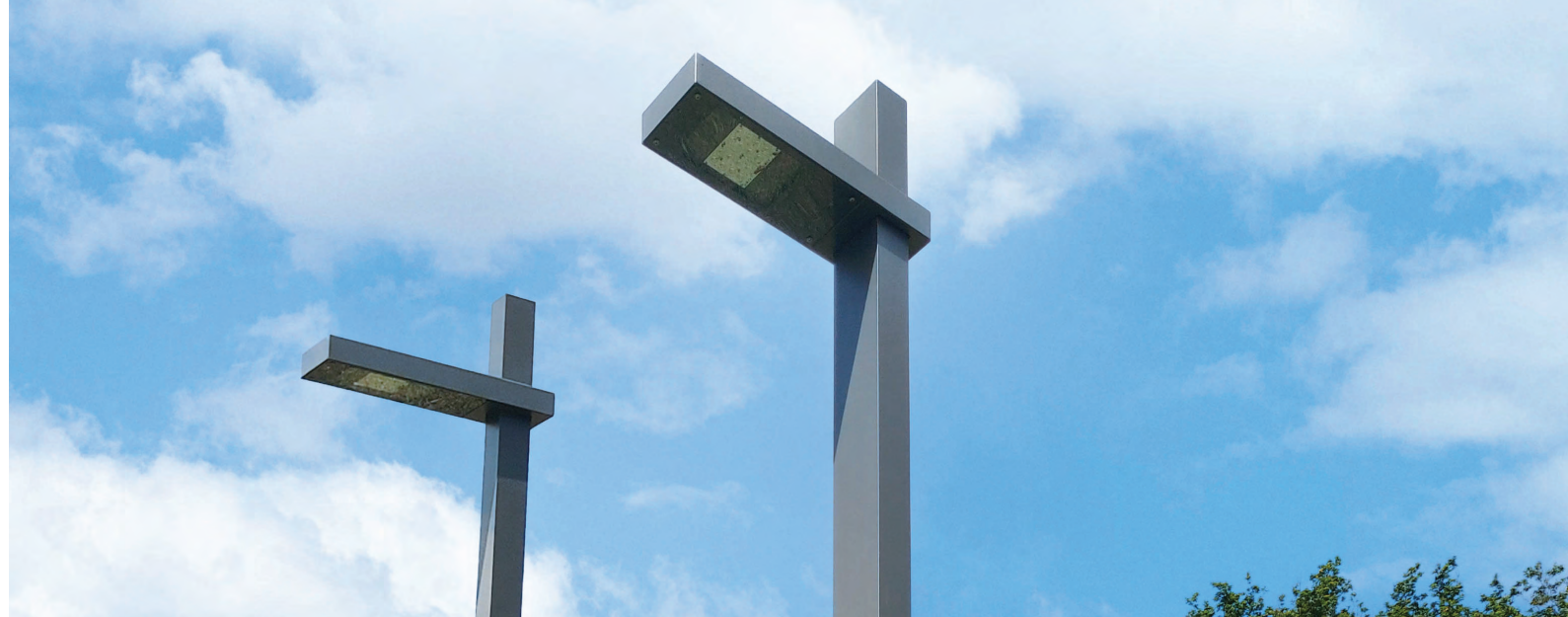
Parque DAEL, Póvoa de Lanhoso DAEL's Park, Póvoa de Lanhoso