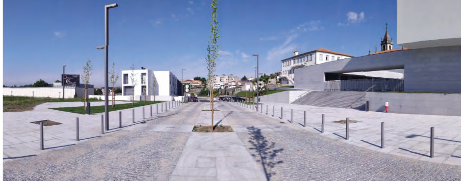
Av. Luis Teles Menezes, Freamunde, Portugal Luis Teles Menezes Avenue, Freamunde, Portugal